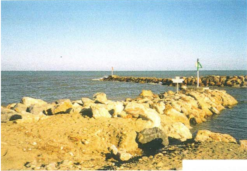
Digue nord et digue sud à l'entrée du port