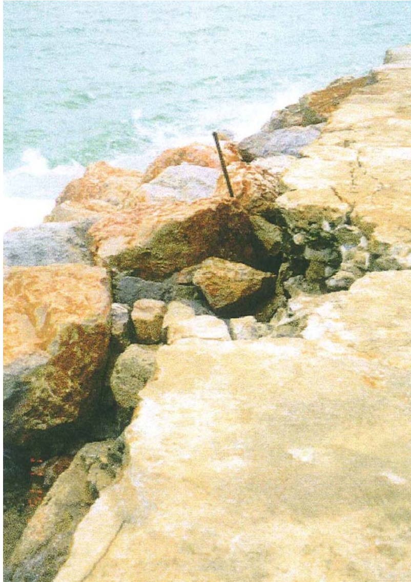
Môle abri – Arrachage de maçonnerie et enrochements déplacés