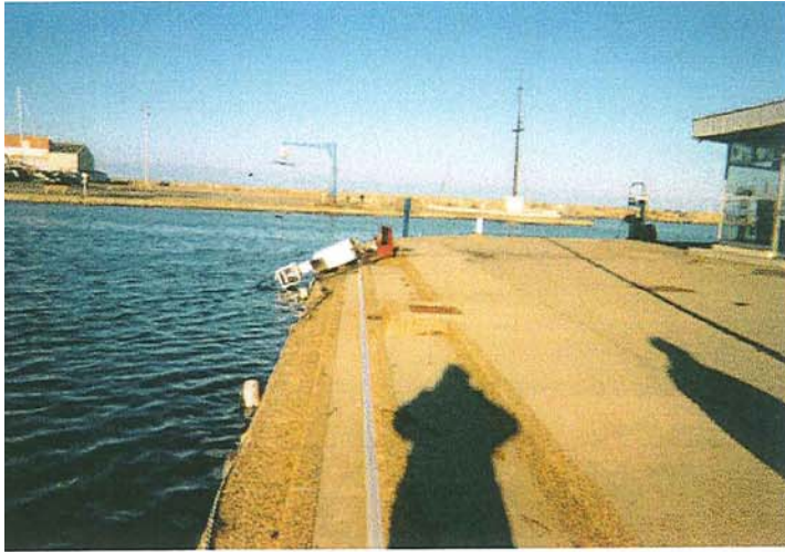
Port - Pompe d'avitaillement arrachée