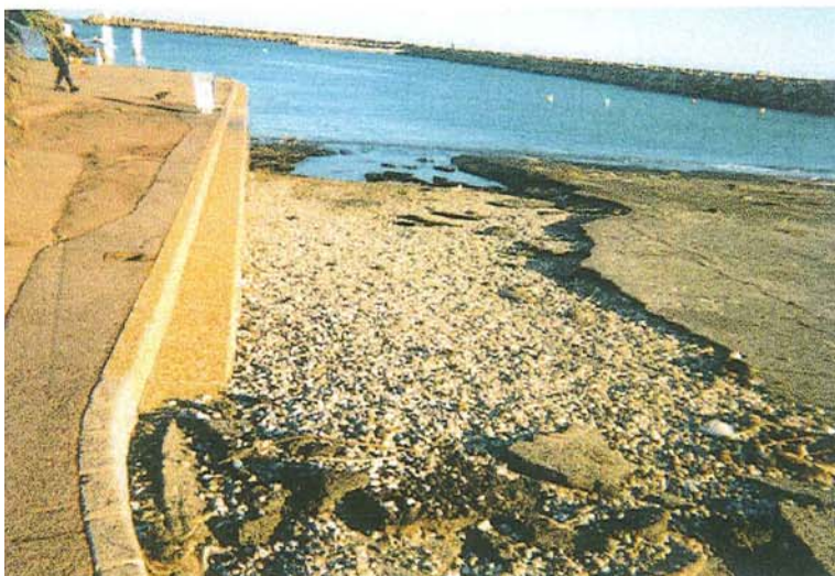
Port - Cale de halage abîmée