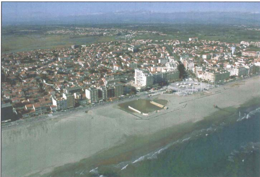
Photographie 7 - Plage située à proximité du Casino

Tempête : Tempête du 12 et 13 novembre 1999