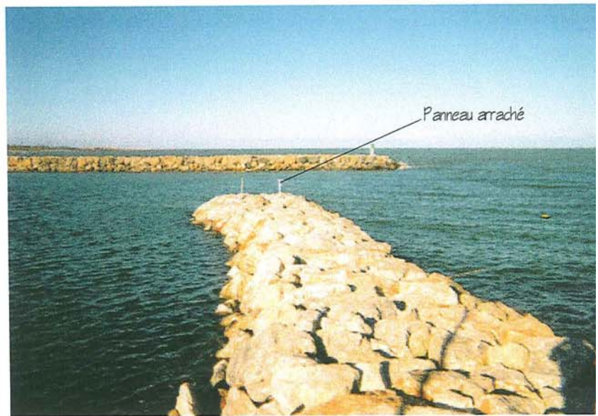
Port - Epi anti houle