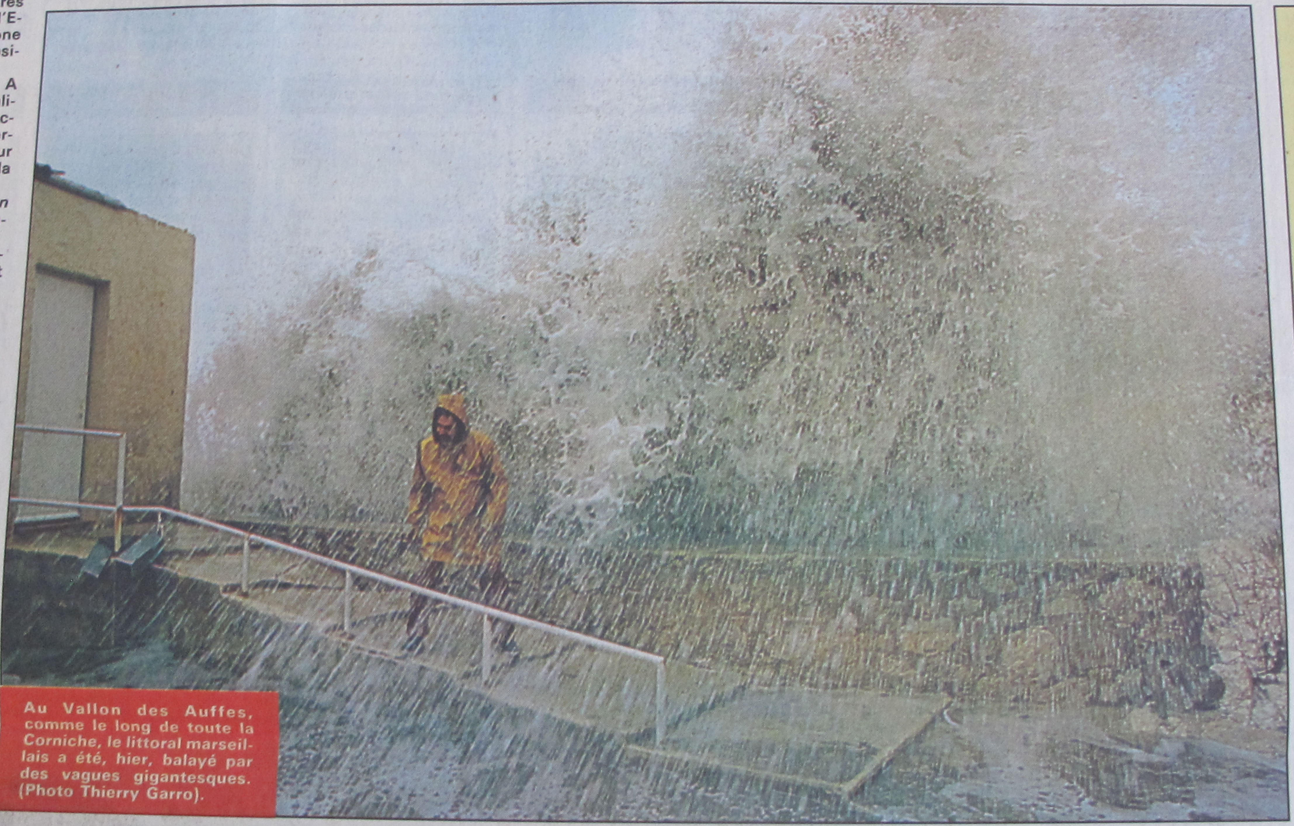
Au Vallon des Auffes, comme le long de toute la Corniche, le littoral marseillais a été, hier, balayé par des vagues gigantesques.

C I di qu br se si ti s' to te p a t c c r P