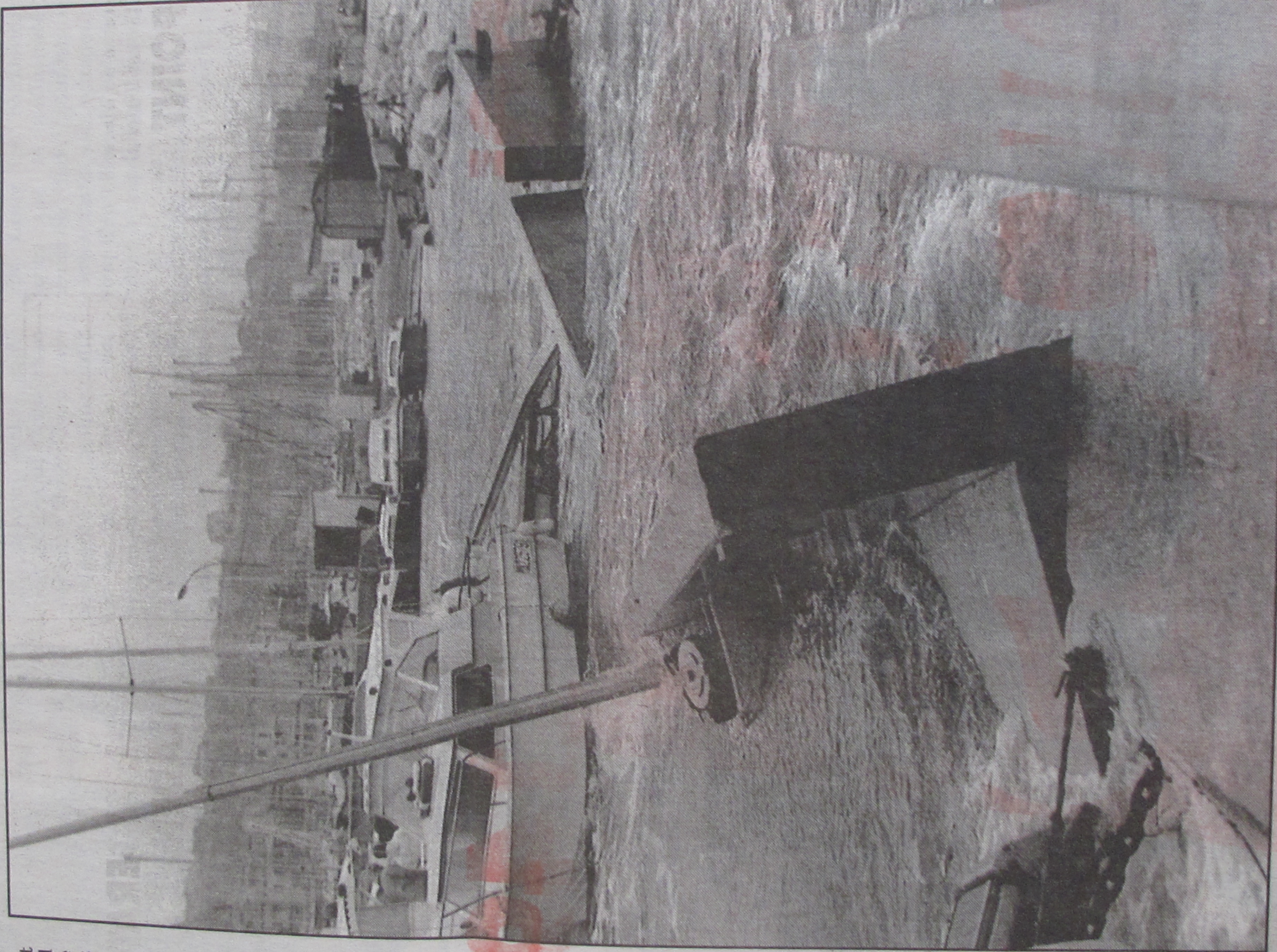
A l'Estaque, une digue s'est rompue et les vagues ont endommagé une quarantaine de bateaux.

che, et littoral ché de mment s Auf- aux si- nt mé- b les à des ui ont que. es ont lques , plus Mais, d'une ment urant coup