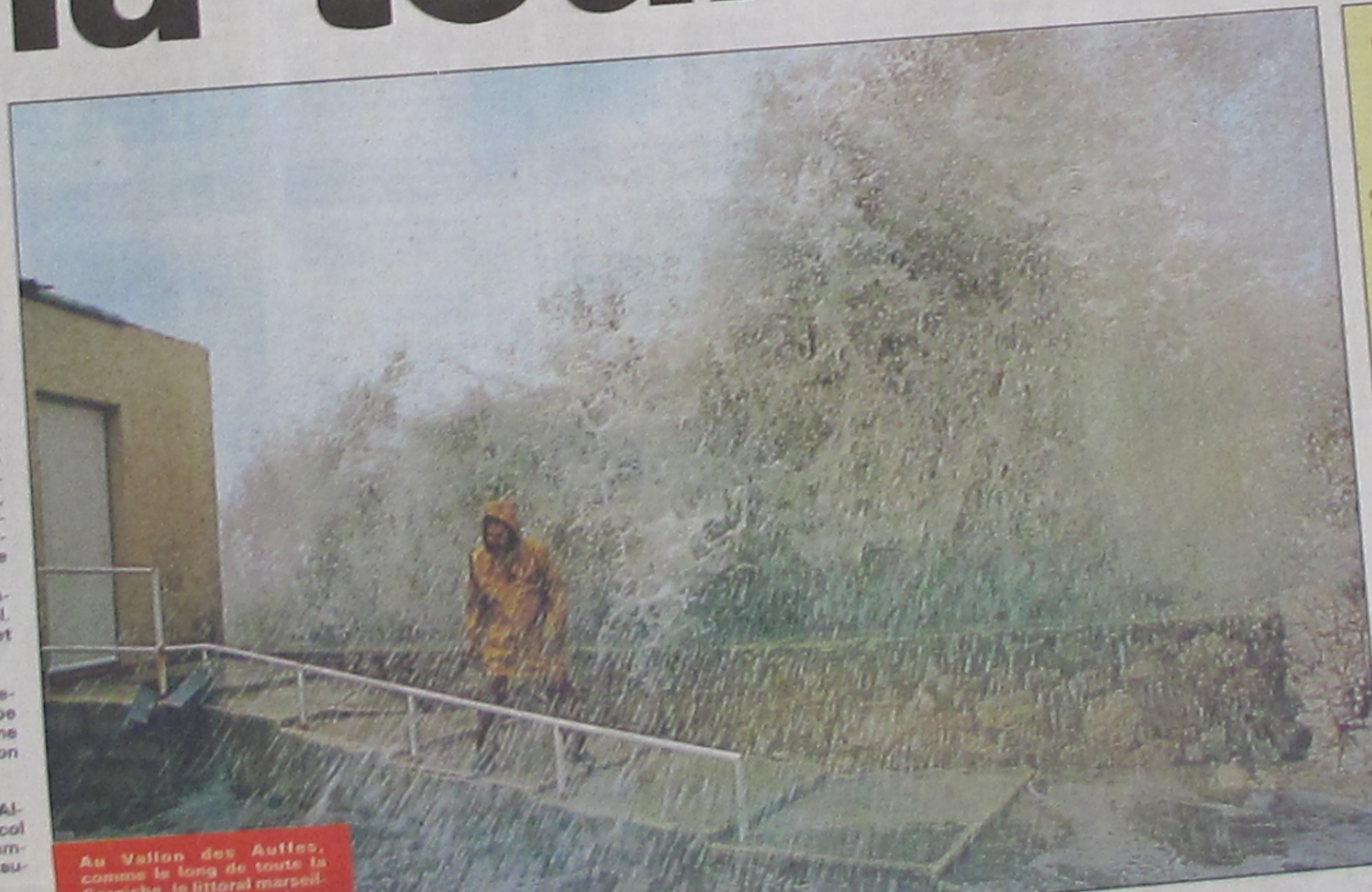
Au Vallon des Auffes, comme le long de toute la Corniche, le littoral marseillais est dévasté par...