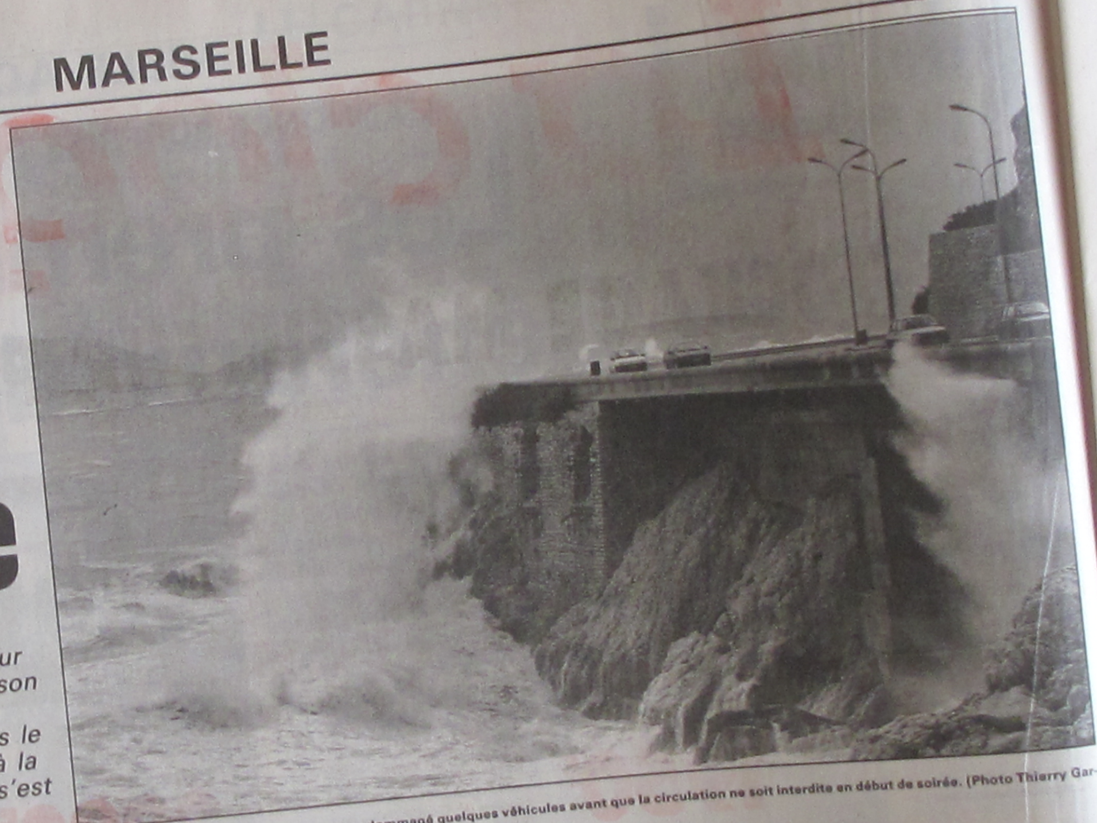
Les vagues à l'assaut de la Corniche ont endommagé quelques véhicules avant que la circulation ne soit interdite en début de soirée.

De fortes pluies se sont abattues hier soir sur Marseille. L'Huveaune menaçait de sortir de son lit, tandis que des vagues gigantesques continuaient à provoquer d'importants dégâts le long du littoral. La corniche a été interdite à la circulation et à l'Estaque une digue du port s'est rompue.