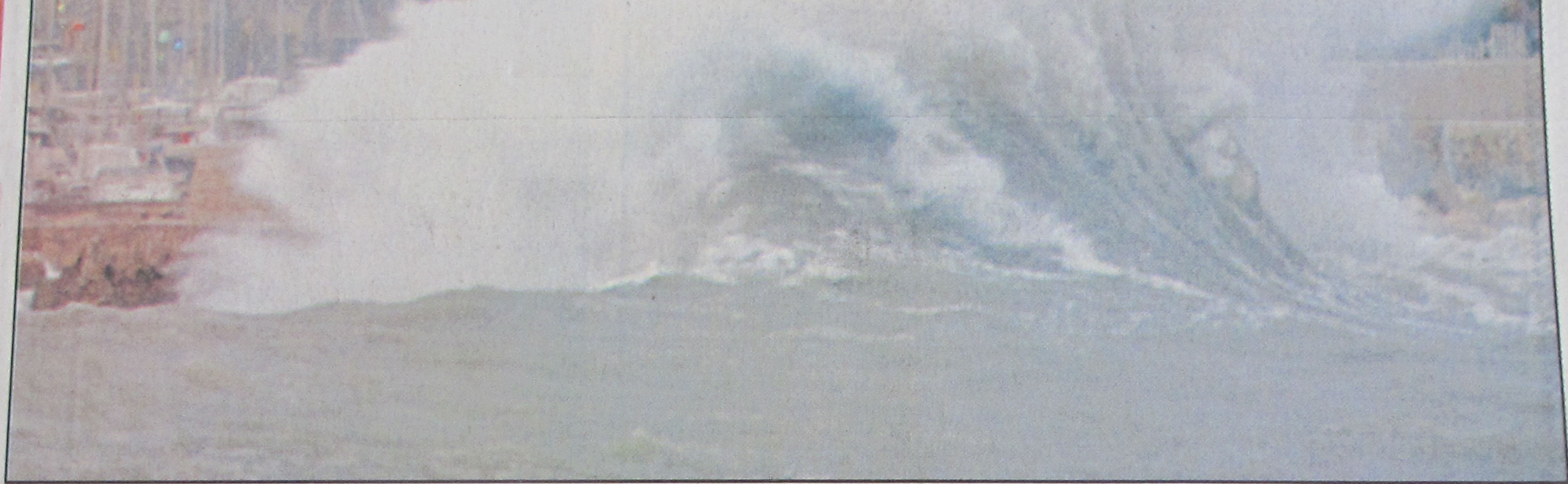
Le phare du port de Cassis submergé par les vagues : de mémoire de Cassidain on avait pas vu ça depuis 30 ans.

Tandis qu'un violent coup de "labé" secouait le littoral et provoquait d'importants dégâts, les pluies diluviennes de la soirée faisaient dangereusement gonfler le cours de l'Huveaune dans l'est de Marseille. L'autoroute Aix-Sisteron a été coupée en raison de la crue de la Durance. Importants risques d'avalanches dans les Alpes.