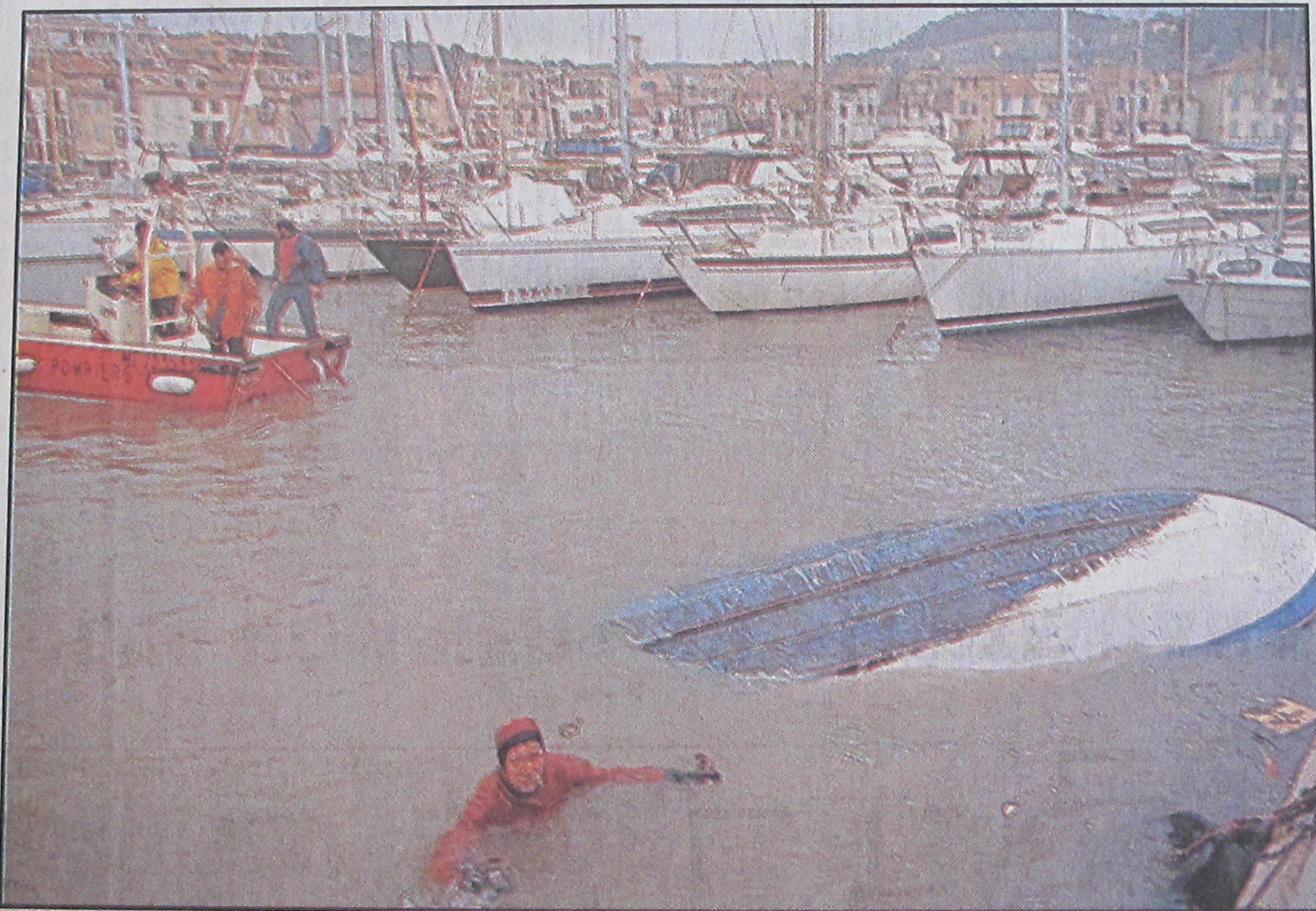
Les pompiers s'emploient à dégager les bateaux coulés par la tempête.

EN PAGES 6 ET DERNIÈRE, LES ARTICLES DE BERNARD CHAILLAN, ALAIN PELOUX, GÉRARD BODINIER, ÉRIC ESPANET ET ANDRÉ-DENIS MOUSSET