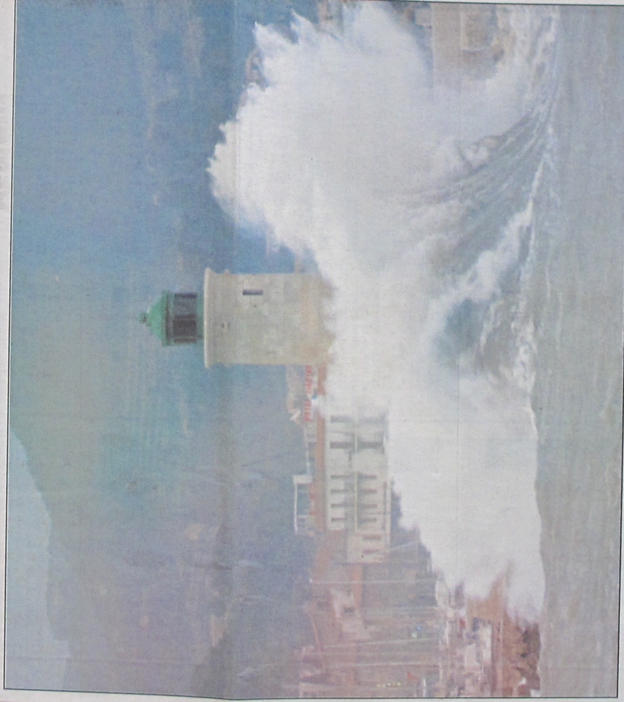
Le phare du port de Cassis submergé par les vagues : de mémoire de Cassidain on avait pas vu ça depuis 30 ans.

Tandis qu'un violent coup de "labé" secouait le littoral et provoquait d'importants dégâts, les pluies diluviennes de la soirée faisaient dangereusement gonfler le cours de l'Huveaune dans l'est de Marseille. L'autoroute Aix-Sisteron a été coupée en raison de la crue de la Durance. Importants risques d'avalanches dans les Alpes.