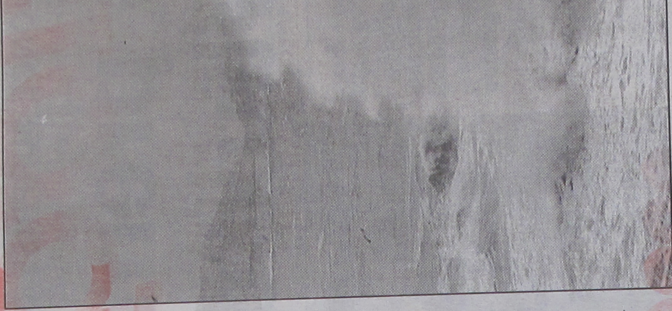
Les vagues à l'assaut de la Corniche ont endro

A Callelongue, aussi, les dégâts ont été relativement importants. De nombreuses embarcations ont également été victimes d'un "coup de Labé", comme on en avait pas connu depuis des lustres. Le "Labé" c'est