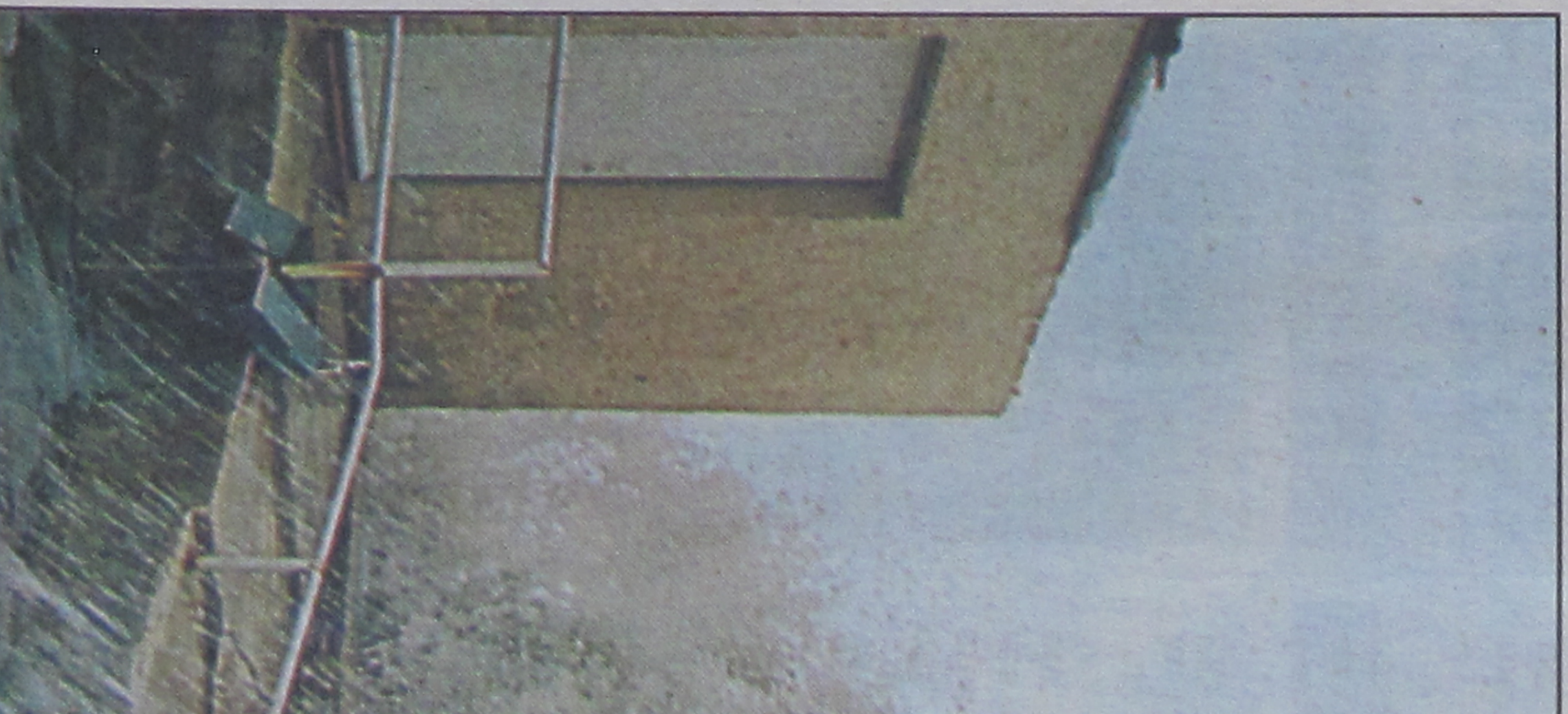
Au Vallon des Auffes, comme le long de toute la Corniche, le littoral marseillais a été, hier, balayé par des vagues gigantesques.