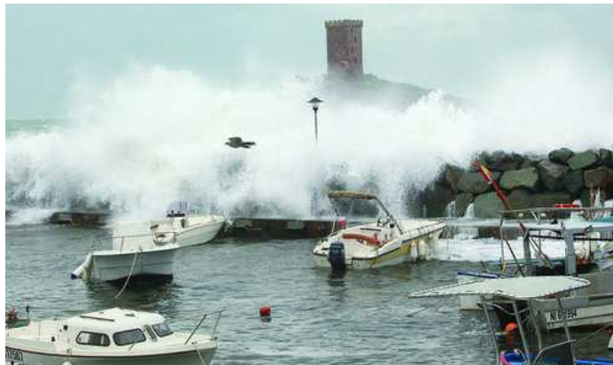
La préfecture du Var a émis un bulletin de vigilance jaune pour des risques de "submersions marines sur le littoral" Christophe Chavignaud