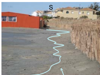
Laisse de mer