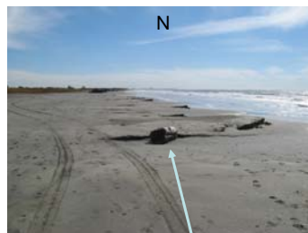
Laisse de mer (tronc d'arbre)