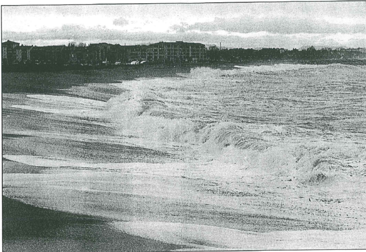
La "Grande Bleue" en furie, hier à Canet-en-Roussillon

Novembre et décembre ont battu des records et les précipitations de ce mardi ont déjà vaillamment lancé les hostilités pour le mois de janvier