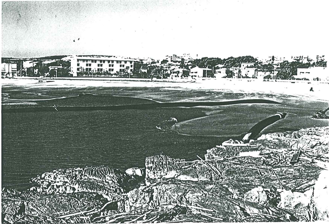
PHOTO N° 5 - ROCHER DE SAINT-PIERRE - "LA BULLE" - Autre vue des canalisations