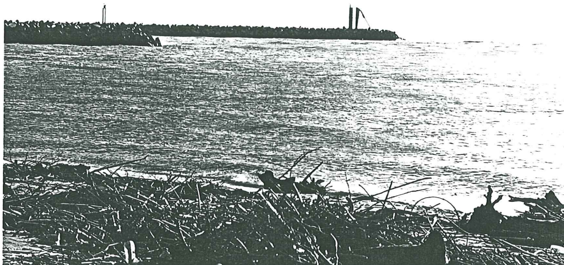
PHOTO N° 1 - Sous réserve d'un examen complémentaire (notamment par voie maritime) les accropodes d'extrémité des musoirs ont "bougé"