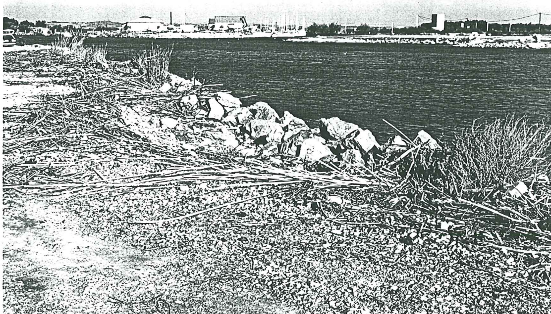
PHOTO N° 2 - Berge rive droite de l'Aude, à l'aval du Port des Cabanes: - le talus en enrochements a été désorganisé et le terre-plein est affouillé à l'arrière.