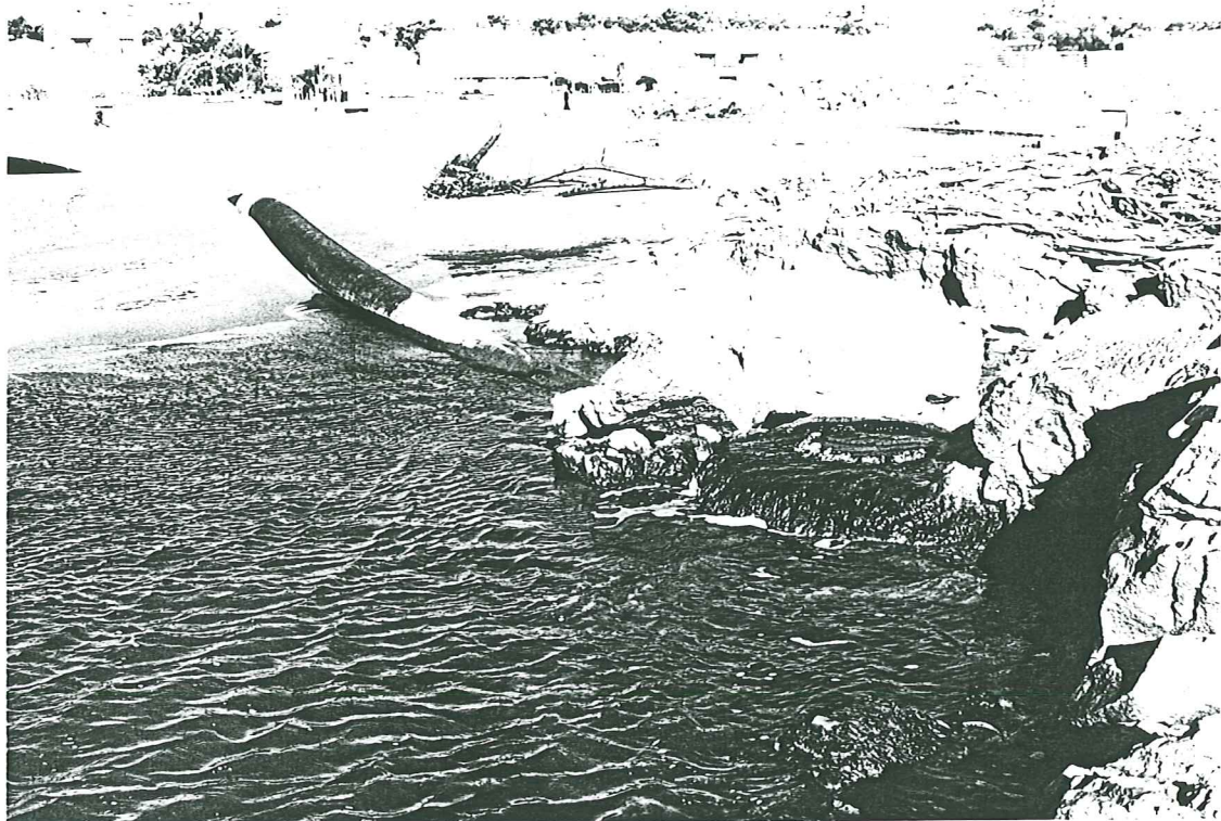
PHOTO N° 6 - ROCHER DE SAINT-PIERRE - "LA BULLE" - Le regard de refoulement "régurgite" par le tampon.