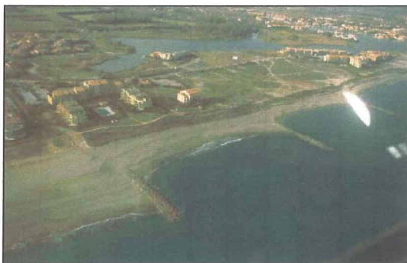
Photographie 1 - St Cyprien Sud

Tempête : Tempête du 16 au 18 décembre 1997