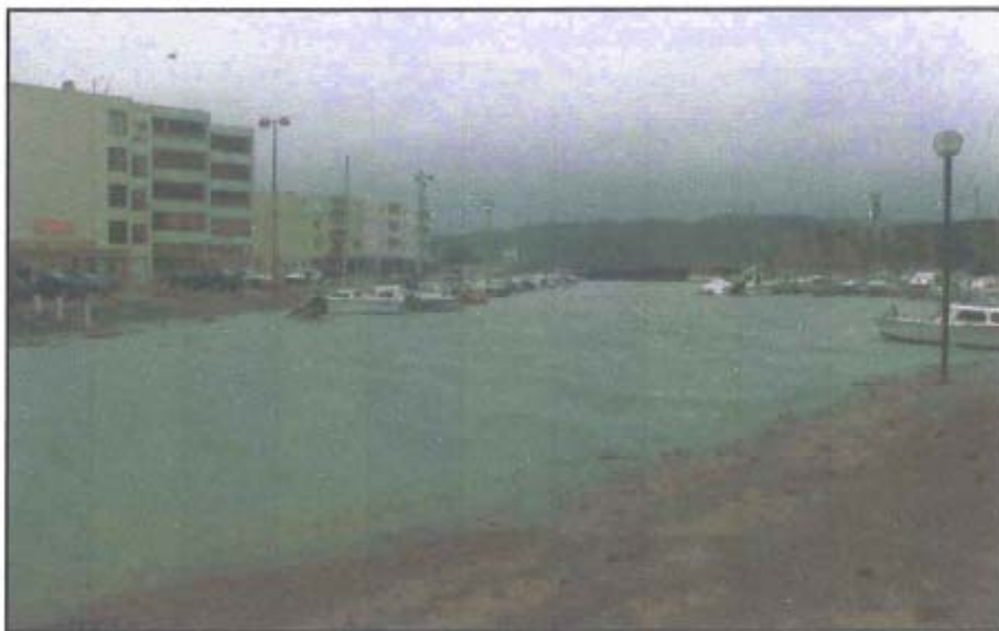
Photographie 1 - Chenal du Port de Plaisance de Narbonne Plage

Tempête : Tempête du 16 au 18 décembre 1997