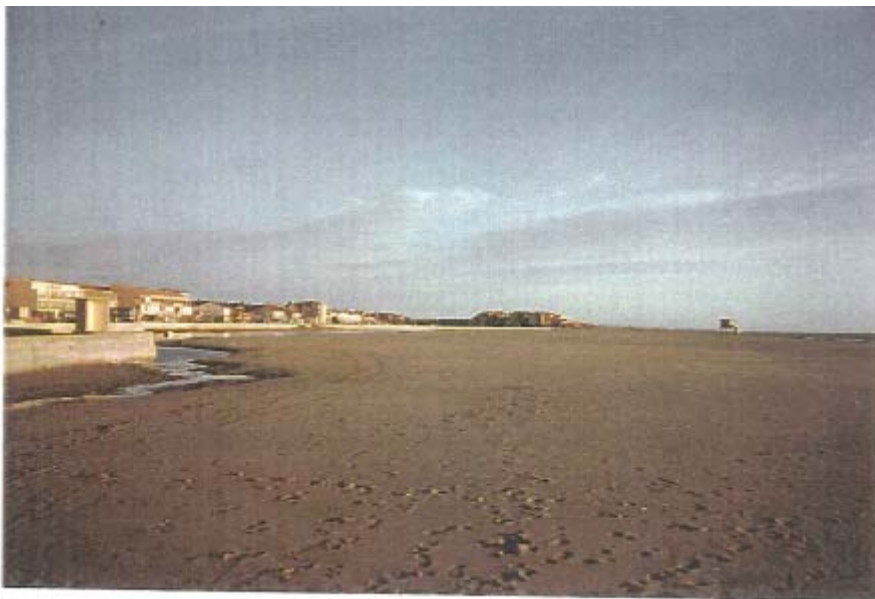
Estran Saint-Pierre-la-Mer centre