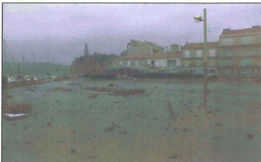
Photographie 2 - St Pierre-sur-Mer