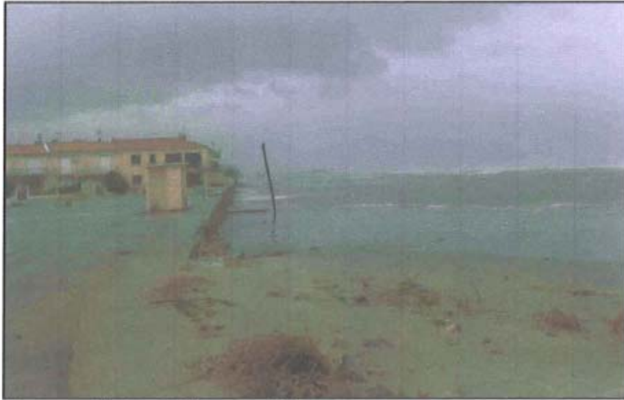
Photographie 3 - St Pierre-sur-Mer