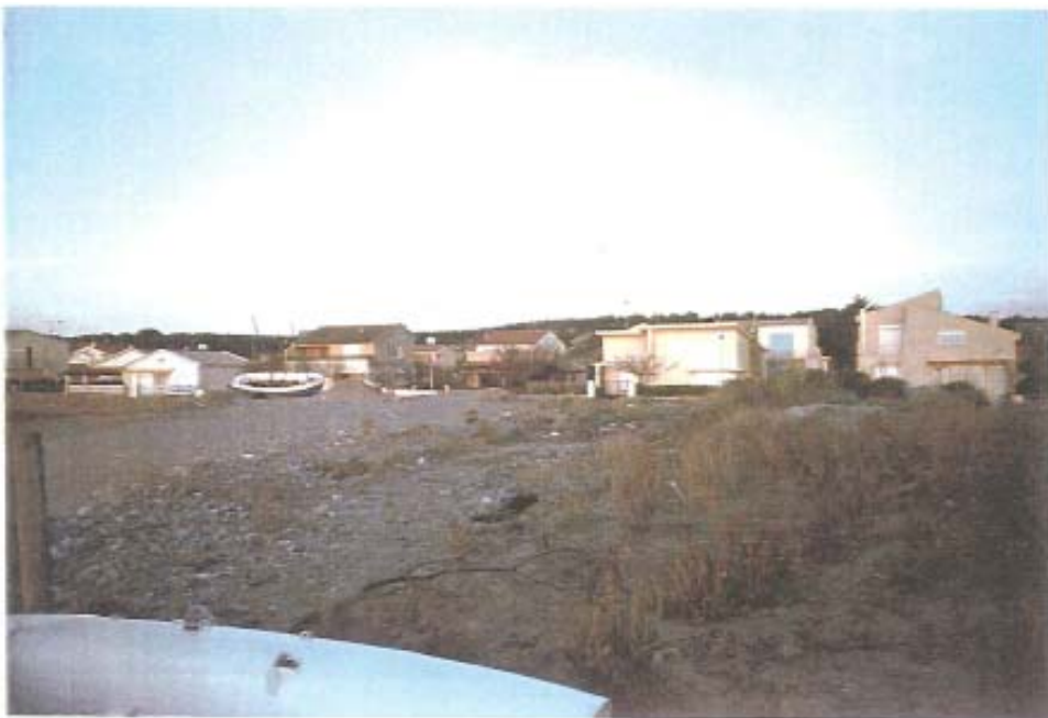
Cordon dunaire – Narbonne Plage