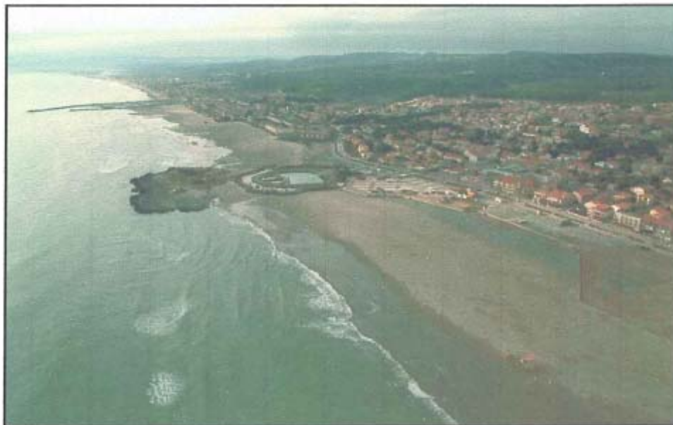
Photographie 4 - St Pierre-sur-Mer - Roc de la Batterie (28 jan 1998)