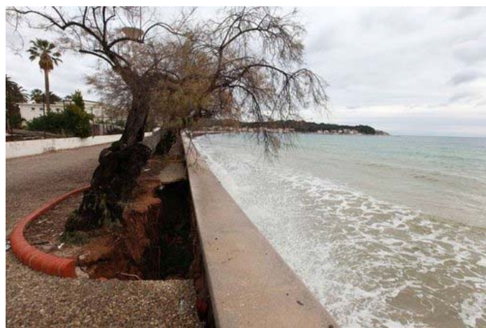
Une partie de la promenade Jean-Charcot est interdite à la circulation, à cause d'un effondrement sur la chaussée. Des particuliers aussi ont fait les frais de la forte houle qui a « tapé » le littoral de La Seyne ces derniers jours.