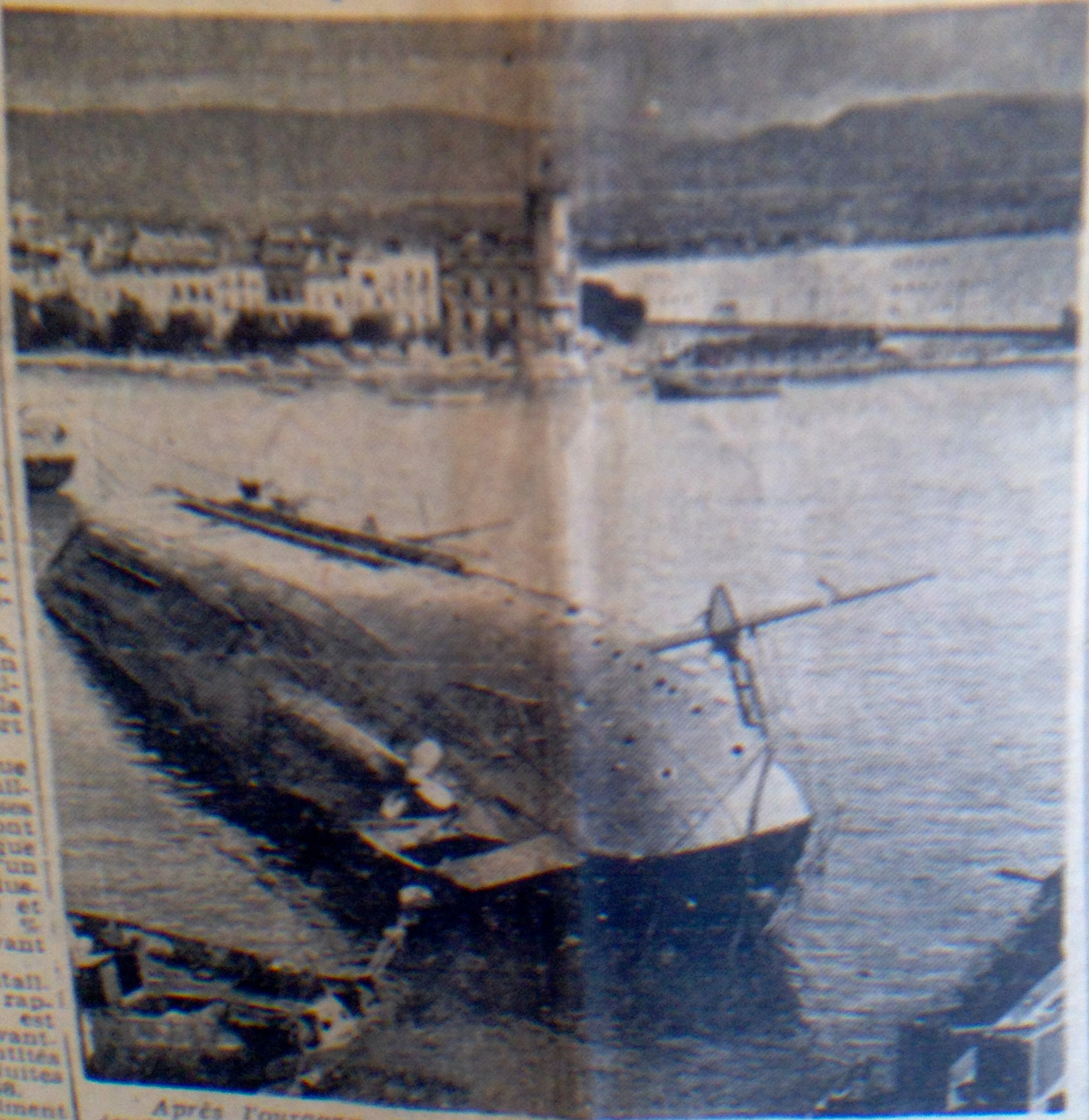
Après l'ouragan qui l'a si durement touché, dans la nuit de jeudi à vendredi, le port de La Ciotat renait à la vie. « La Marseillaise » a pu être remise à quai. « L'El-Mansour », ayant été allégé de 70 tonnes d'eau de son « peack » d'étrave, son avant flotte à nouveau. Des efforts sont tentés pour le redresser complètement. Le paquebot « Cyrnos », on s'en souvient, ayant rompu ses amarres, fut drossé dans le port et, la montée des eaux aidant, il vint s'échouer dans la partie peu profonde de la darse de l'Hôpital. Notre photographe l'a saisi, complètement couché sur le flanc, après la baisse des eaux.