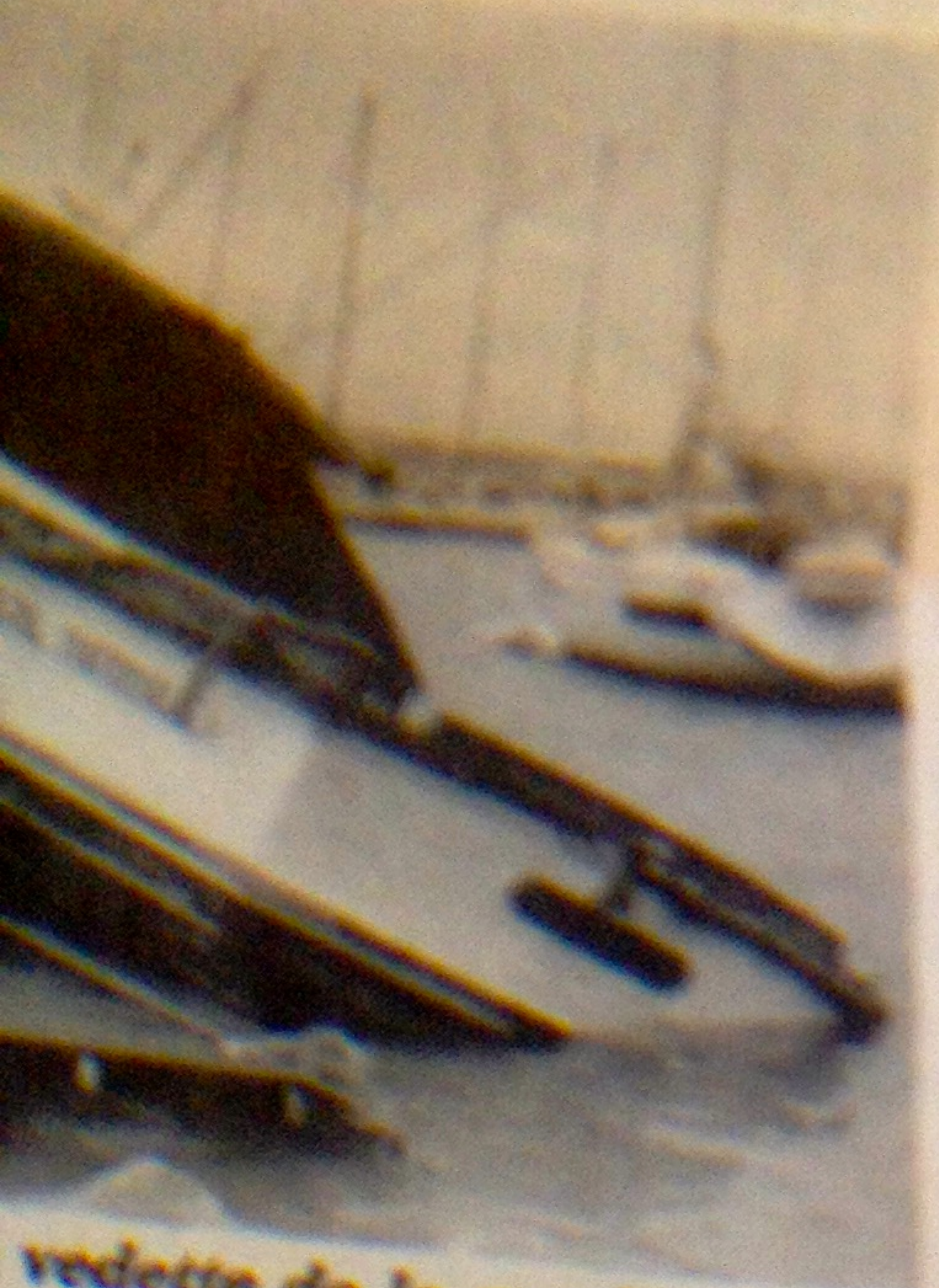
vedette de la gendarmerie pêpe. (A.F.P.)

es bas quartiers de Sainte- nimie ont été envahis par le am dont la crue a rendu im- ossible la traversée automo- bile de Millau (Aveyron). Enfin, l'Ardèche a dépassé de six mètres sa côte d'alerte au sud d'Aubenas.