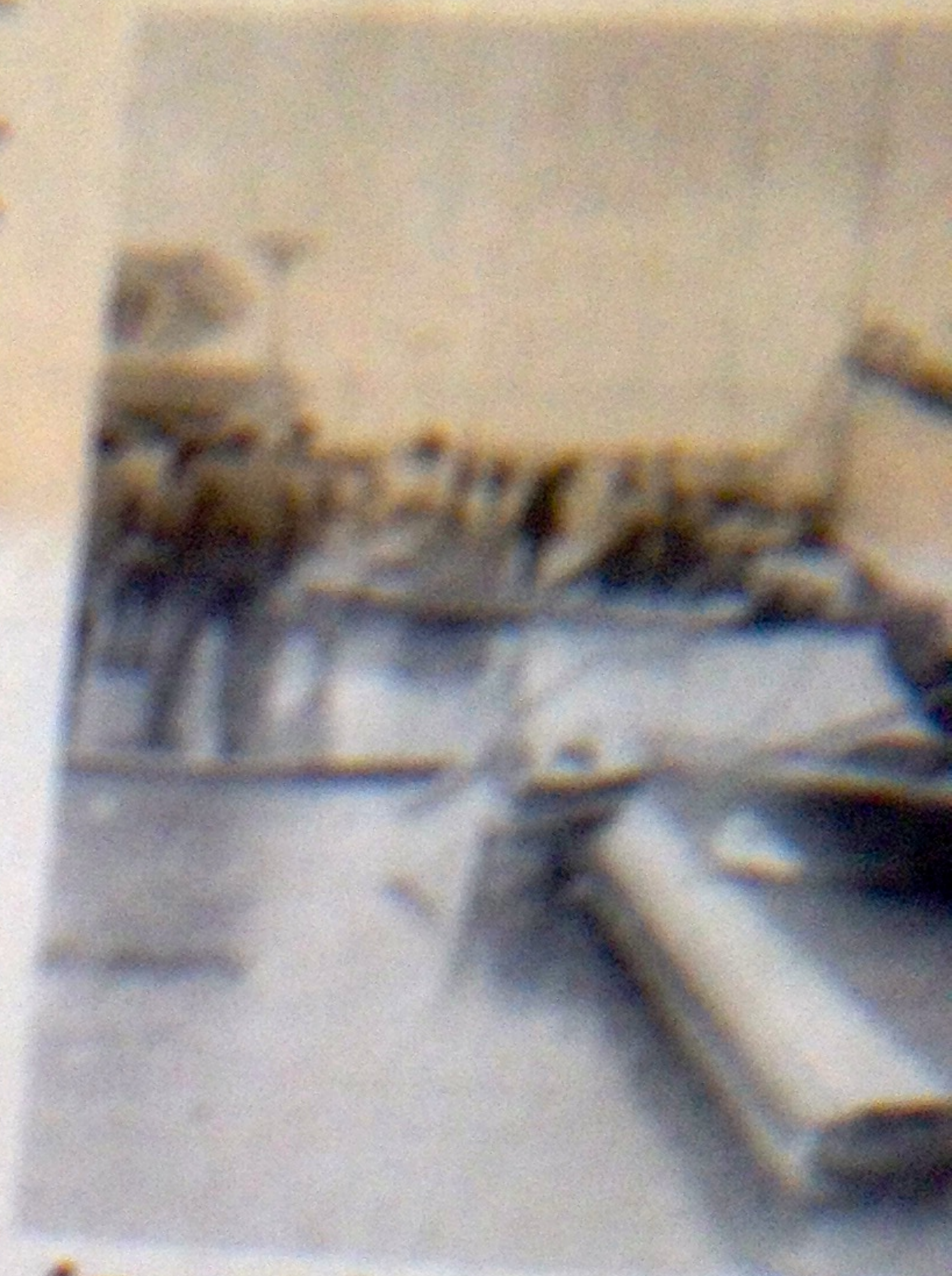
Au port de plaisance de... n'a pas résisté la violence

dans les secteurs de Moirans, Voreppe et Voiron, plusieurs communes étaient toujours isolées lundi après-midi.