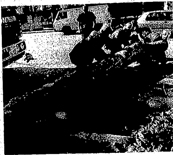
Les pompiers varois se sont affairés toute la journée.

C'était au tour des cheminées d'entrée dans la folle sarabande de cette exceptionnelle tempête. Rue d'Alap, une vieille cheminée se renversait sur la toiture d'une villa, au point d'en crever le plafond. Pas de blessé, mais d'importants dégâts matériels. Tan-