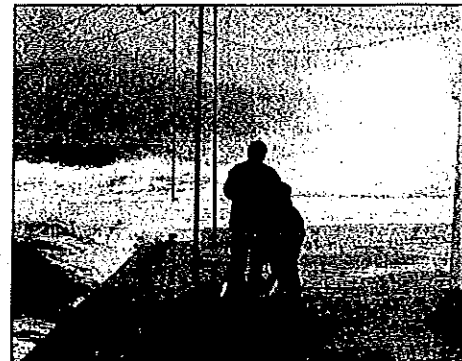
▲ A Agay, ce beau bateau de plaisance s'est échoué sur le rivage, tandis que