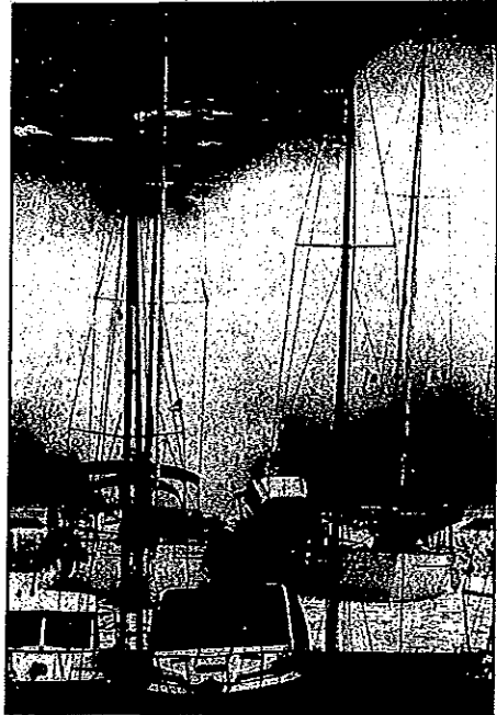
▲ Mer de vagues contre le port de Bormes. ▲ Jour de tempête dans le golfe de St-Tropez.