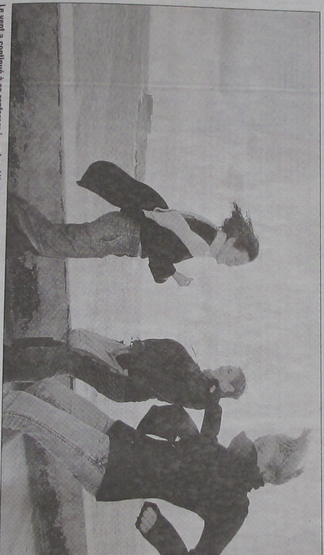
Le vent a continué à se renforcer jusqu'en début de soirée. Les rafales devaient progressivement s'atténuer. La préfecture recommande la plus grande prudence et de limiter les déplacements sur les routes et les autoroutes.

Un vent violent a balayé la ville hier avec des rafales à 130 km/h. Un phénomène exceptionnel qui a causé des dégâts dans les parcs publics et sur le Vieux-Port