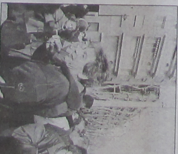
Après la réunion, les opposants aux projets de loi se sont réunis sur la place du 4-Septembre, destinée à être un lieu de rassemblement

Moins nombreux que la veille, ils étaient quelque 150 à se retrouver, ensuite, sur la place du 4-Septembre, tandis que les autres restaient à la réunion. A défaut, l'organisation fait appel à la spontanéité du dé-