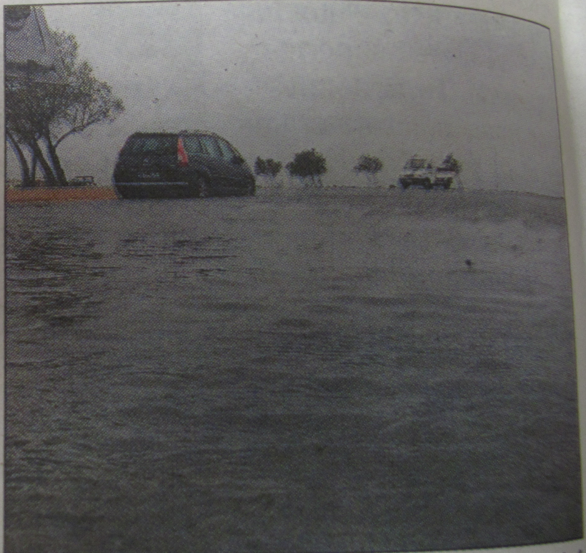
Le parking su port de Saint-Tropez a été inondé.