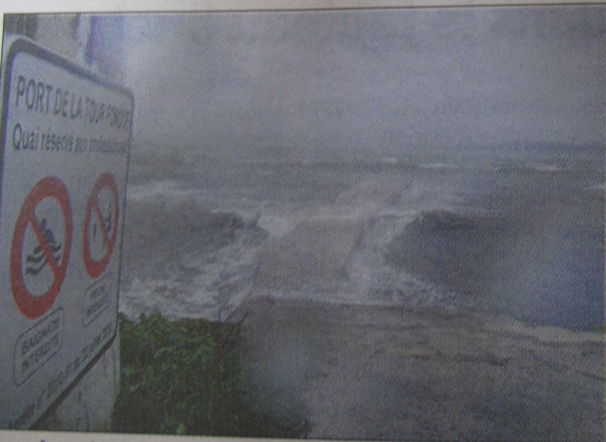
Les abords de la Tour fondue à Giens, fortement secoués par un vent atteignant les 70 nœuds.