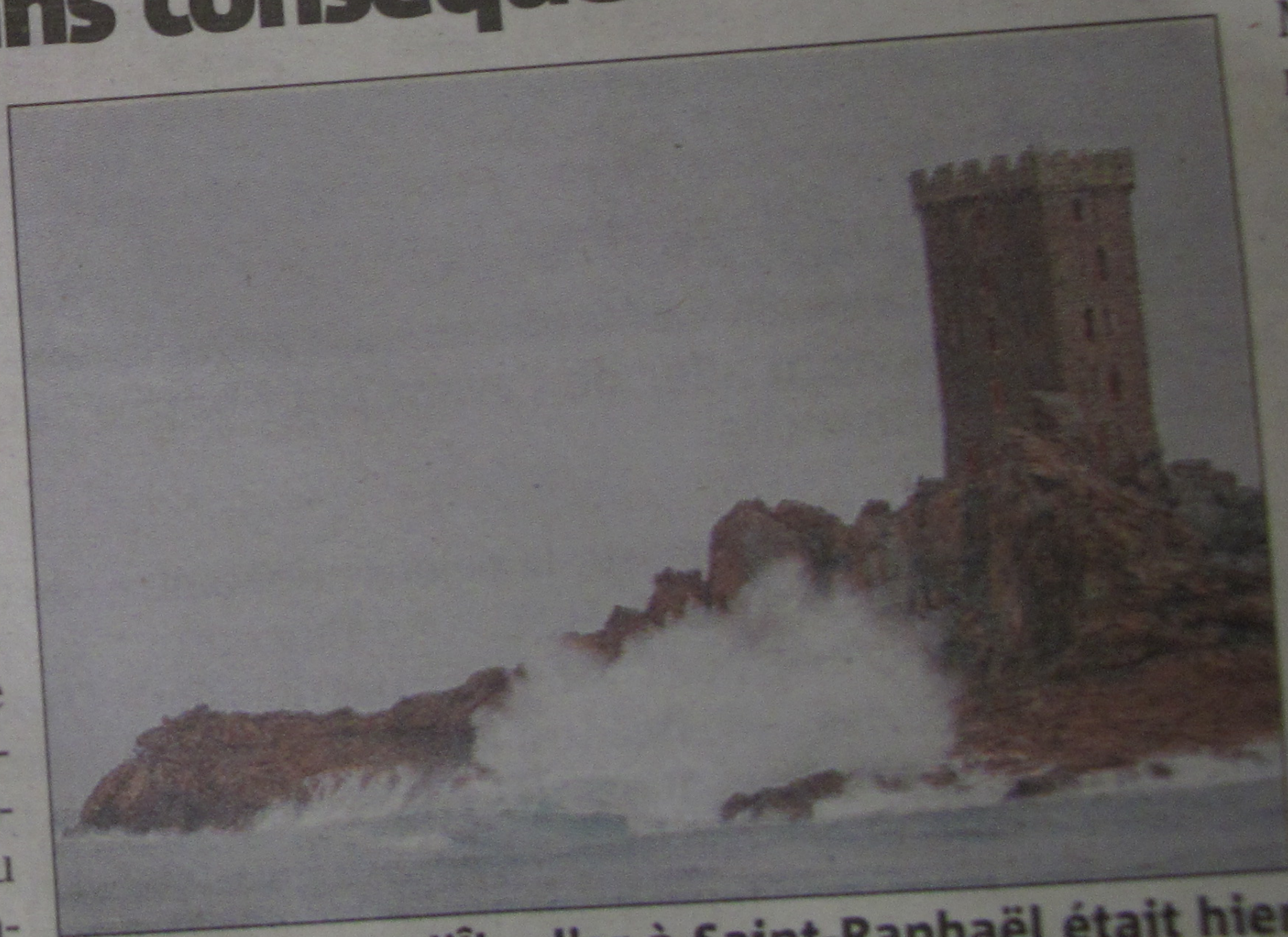
La mer devant l'île d'or à Saint-Raphaël était hier mouvementée mais n'a pas causé de dégâts.

Une alerte météo qui hier faisait peur mais n'aura causé aucun dégât à Fréjus et Saint-Raphaël, si ce n'est un arbre tombé sur une voie ferrée et très vite dégagé. Au matin les rouleaux menaçaient et le parking Bonaparte de Saint-Raphaël, proche de la mer, fermait son étage inférieur. À Fréjus, par précaution le parc de la villa Aurélienne fermait ses portes pour éviter tout risque éventuel de chutes de branchages. Rien ne troublait la tranquillité. Mais paradoxalement, alors que le vent soufflait peu au ras du sol, le sémaphore du Dramont, haut perché, enregistrait une rafale à 163 km/h. Sans doute un record.