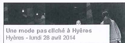
Une mode pas cliché à Hyères Hyères - lundi 28 avril 2014