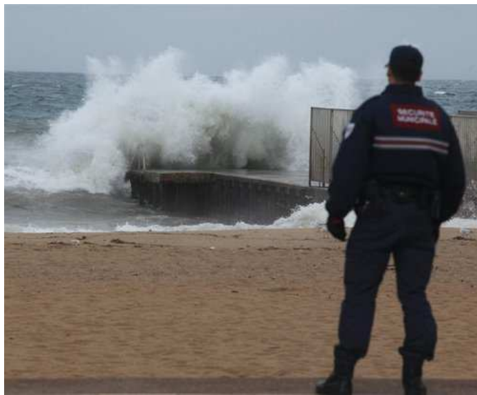
La mer déchaînée à Fréjus-plage en 2009