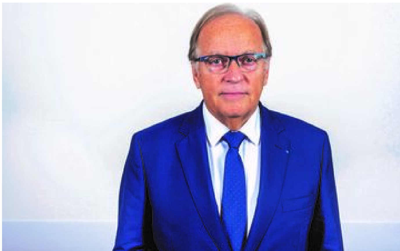
#MeToo à l'hôpital : le président du Conseil de l'Ordre des médecins reconnaît un climat « d'omerta »