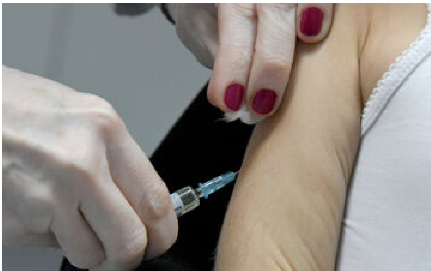
Plus de 55 000 cas en trois mois : l'OMS alerte sur la flambée des cas de rougeole en Europe