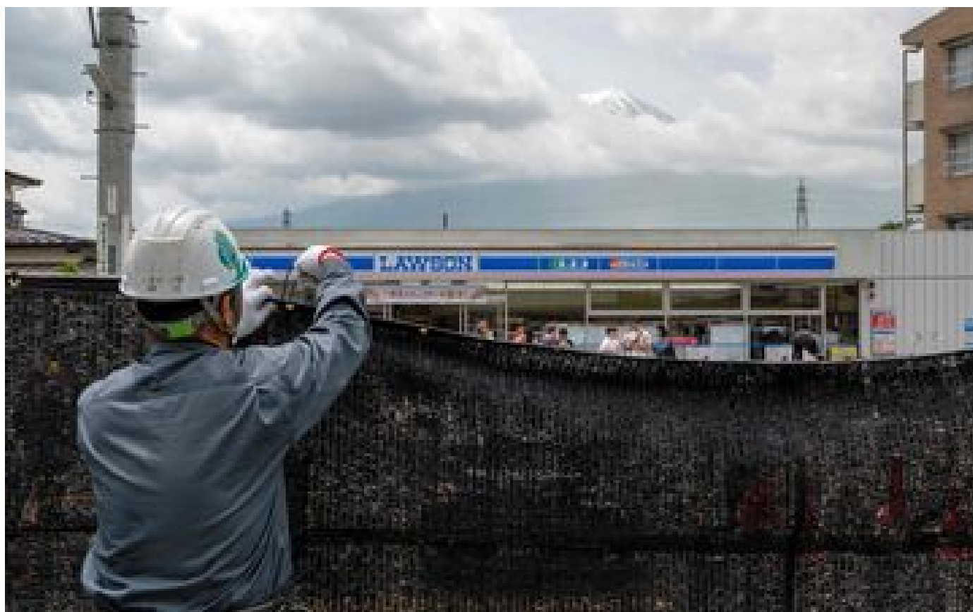
Japon : installée pour « cacher » le Mont Fuji, la bâche anti-touristes est déjà vandalisée