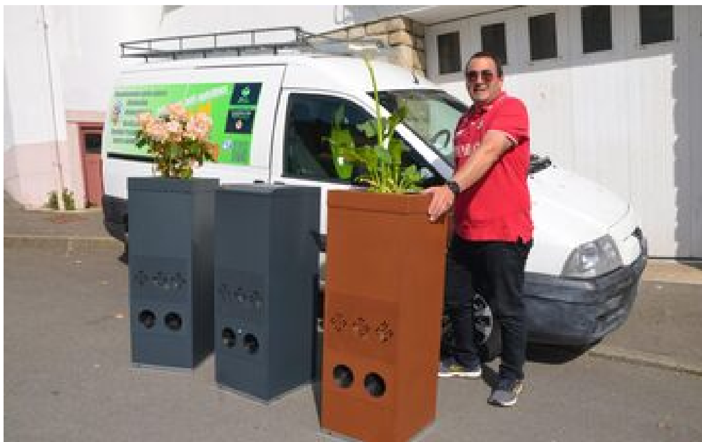
Ce Breton vend des pièges à moustiques-tigres qui imitent... la transpiration humaine