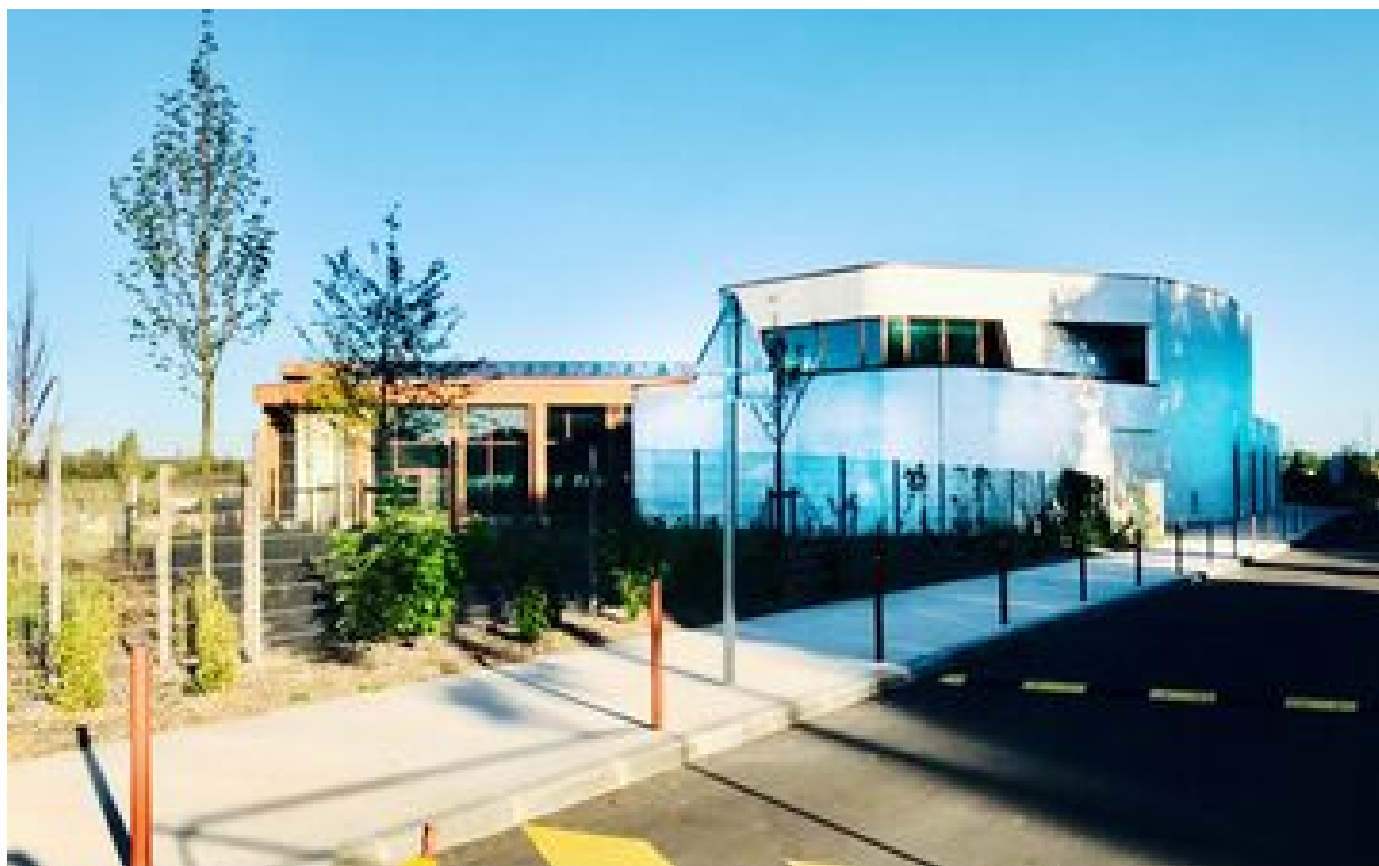
Sans chlore dans son eau, la piscine de Belbeuf interdite d'ouvrir ses portes