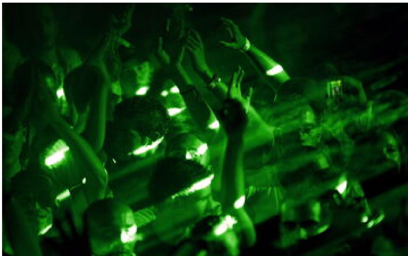
« Un sujet de société bien plus profond » : face aux ravages du chemsex, des députés demandent au gouvernement d'agir