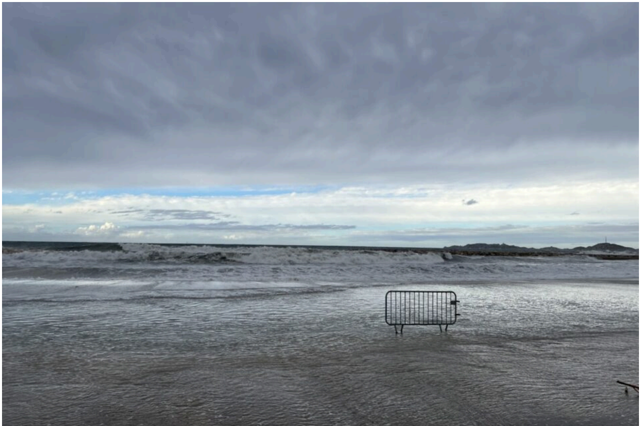
La plage du Prado ce vendredi matin, à Marseille. Et ses vagues.

Certains s'y sont aventurés, mais ont dû redoubler de vigilance , le courant ne cessant de ramener des vagues sur la digue marseillaise.