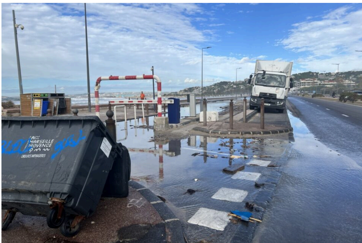
Le parking de la plage de l'Huveaune ce vendredi matin à Marseille.

A Marseille, des intempéries ont causé des dégâts le long du littoral. C'est notamment le cas aux abords des plages du Prado, dans le 8e arrondissement. Les images.