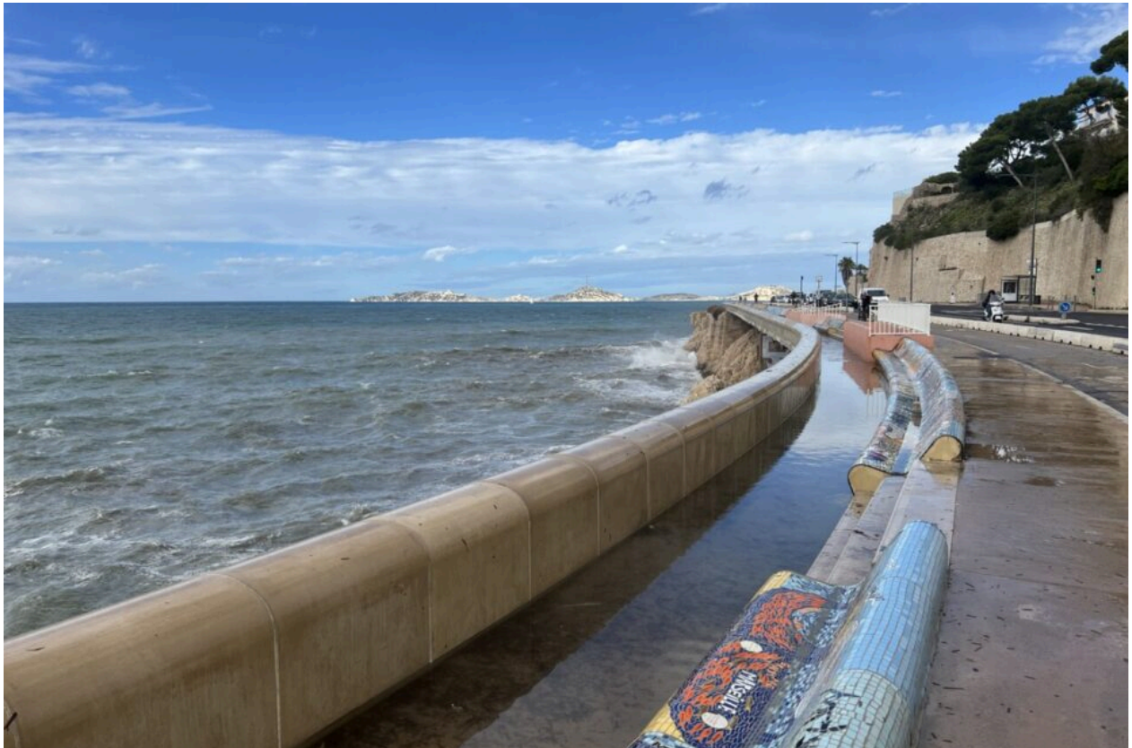
Une partie de la Corniche inondée ce matin, à force d'encaisser les vagues.