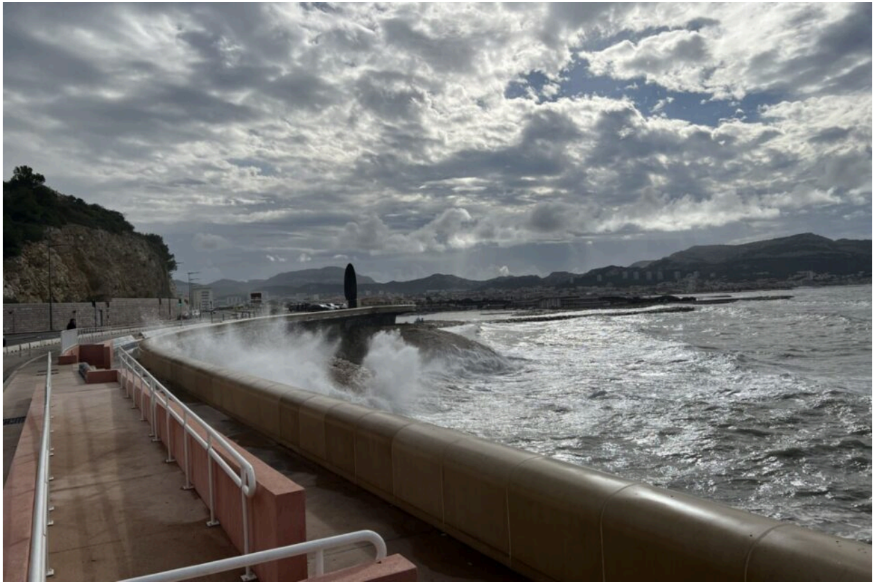
La Corniche de Marseille ce vendredi matin.

Bien des Marseillais prenaient le temps de s'y attarder, en faisant tout de même attention à ne pas se laisser submerger.