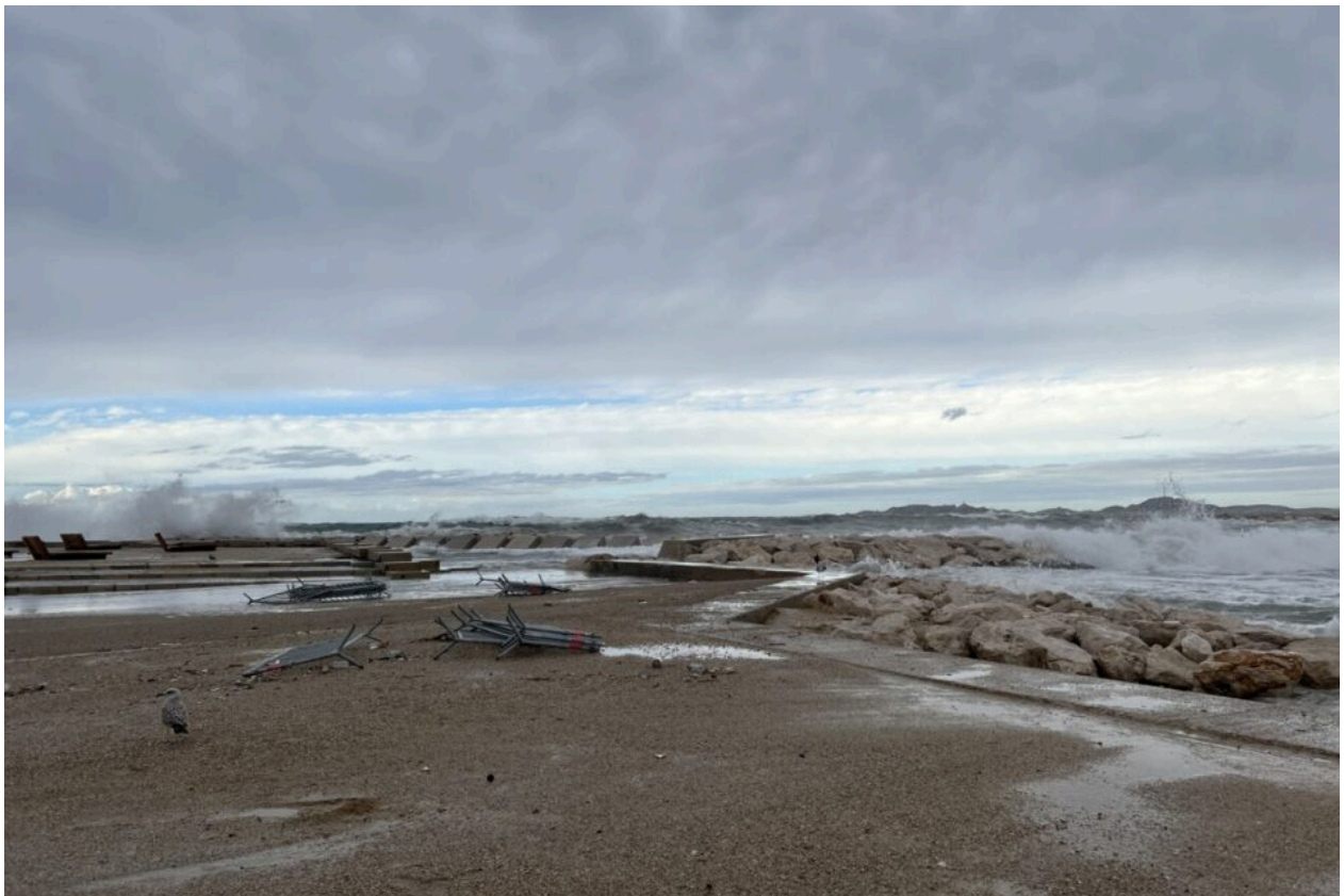
Sur la plage du Prado à Marseille, ce vendredi 20 octobre 2023.