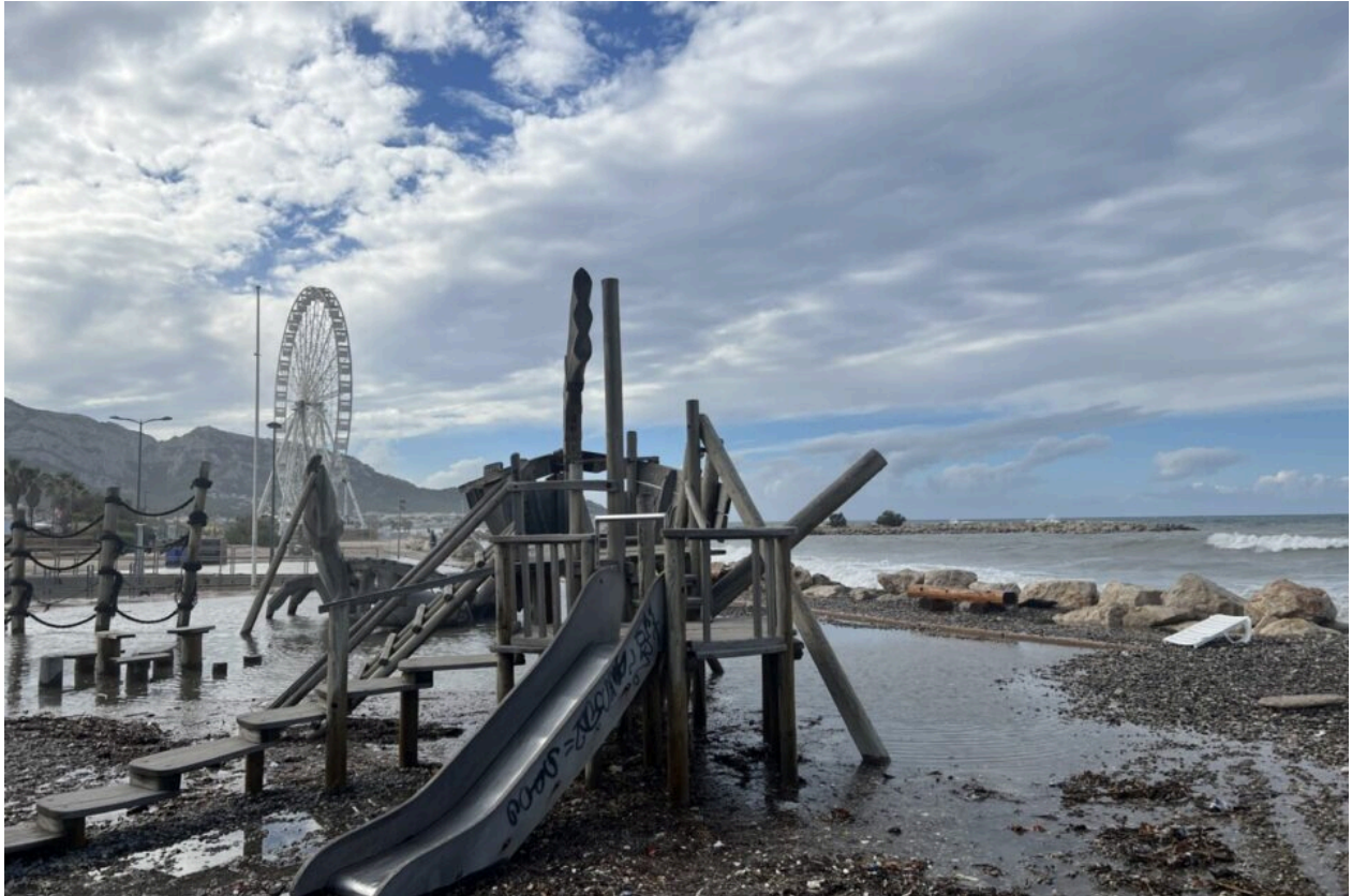
Les jeux pour enfants de l'espace Borely, à Marseille.

Mais il reste inhabituel pour un phocéén de trouver une piscine à la place d'un parking ou même de constater que certaines plages, comme celles de l'Huveaune ou du Prophète, avaient quasiment disparues pour laisser place à la mer.