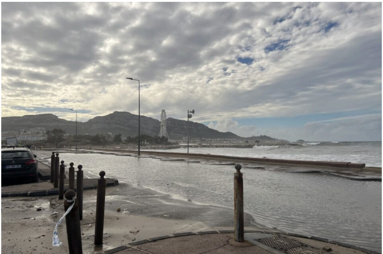
Devant la plage de l'Huveaune à Marseille, ce parking est totalement inondé.