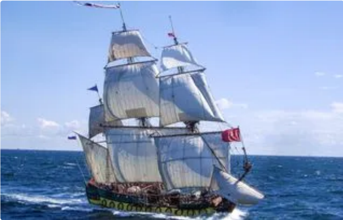
DIAPORAMA Des centaines de milliers de personnes pour les voiliers d'Escale à Sète