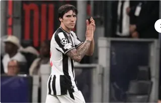
PARI EST TRAGIQUE Howe soutient Sandro Tonali dans sa lutte contre l'addiction aux jeux