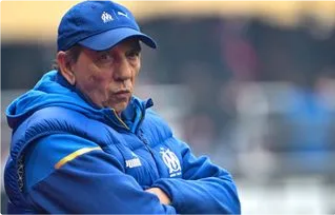
CLASSIQUE « Au foot, il y a toujours de l'espoir », Gasset y croit malgré les blessures