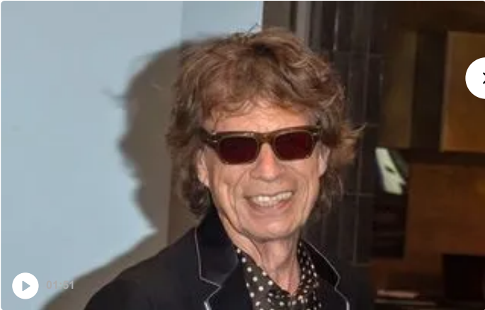
FIL DES STARS Mick Jagger et 50 Cent sont dans le Fil des Stars.